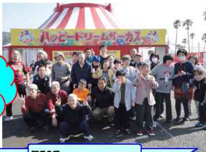
第20回 ピュアハートコンサート♪