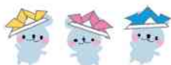
(つつじが丘苑 副主任 岩橋 健司)