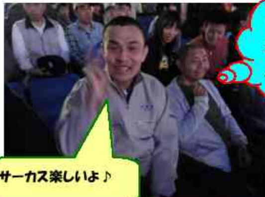
サーカス楽しいよ♪