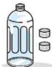
500mlペットボトル (濃い消毒液)