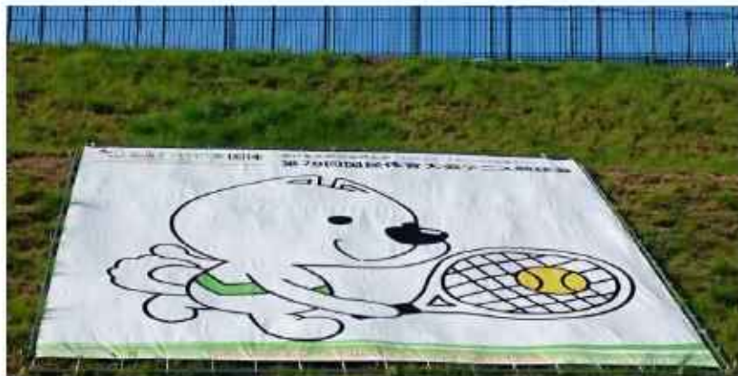
(つつじが丘苑 生活支援員 宇都宮 綾子)