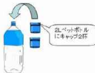
2L ペットボトル (薄い消毒液)