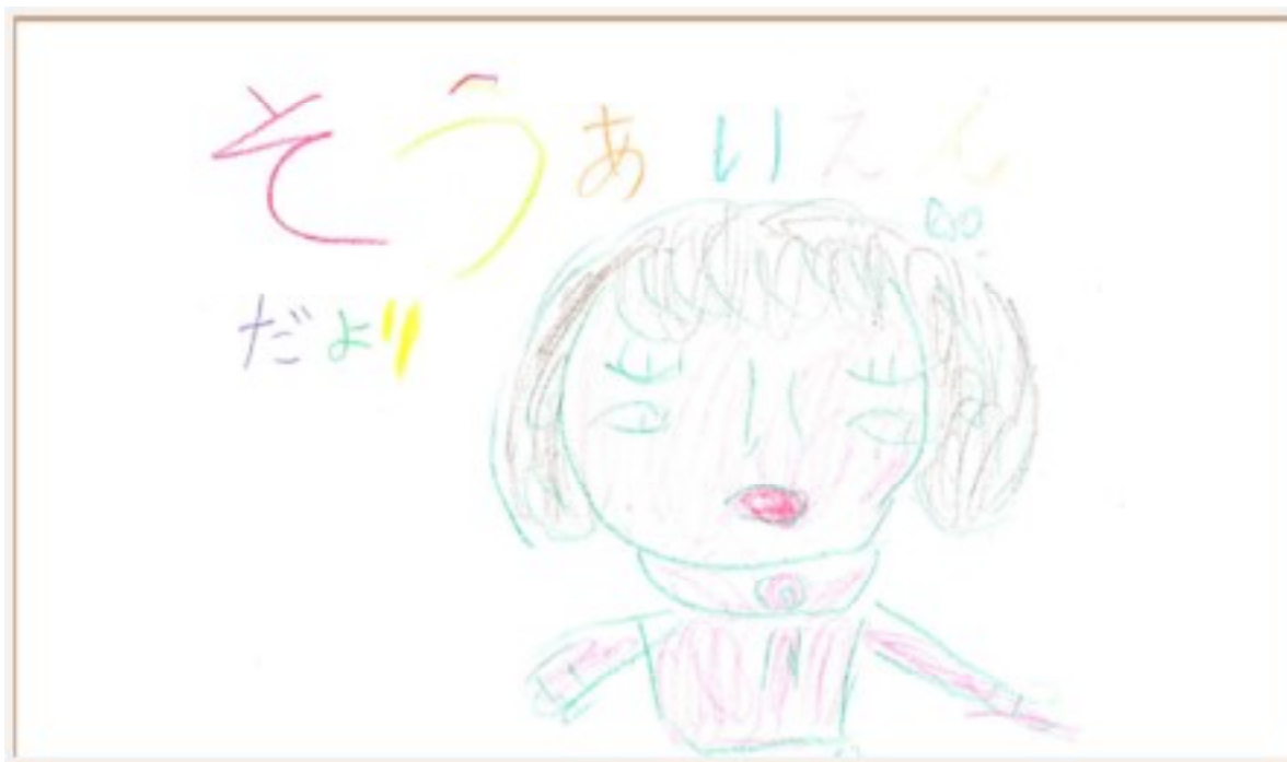
(綜愛苑入所利用者)

今年も早いもので、もう師走となりました。 それぞれの苑では、クリスマスの飾りで賑やかとなり、あたたかな笑顔で溢れています。 年末年始を控えて皆さま方には、忙しい日々をお過ごしのことと存じますが、一年の締めくくりとして、やり残したことを片付け新たな気持ちで、平成31年を迎えていただきたいと思います。