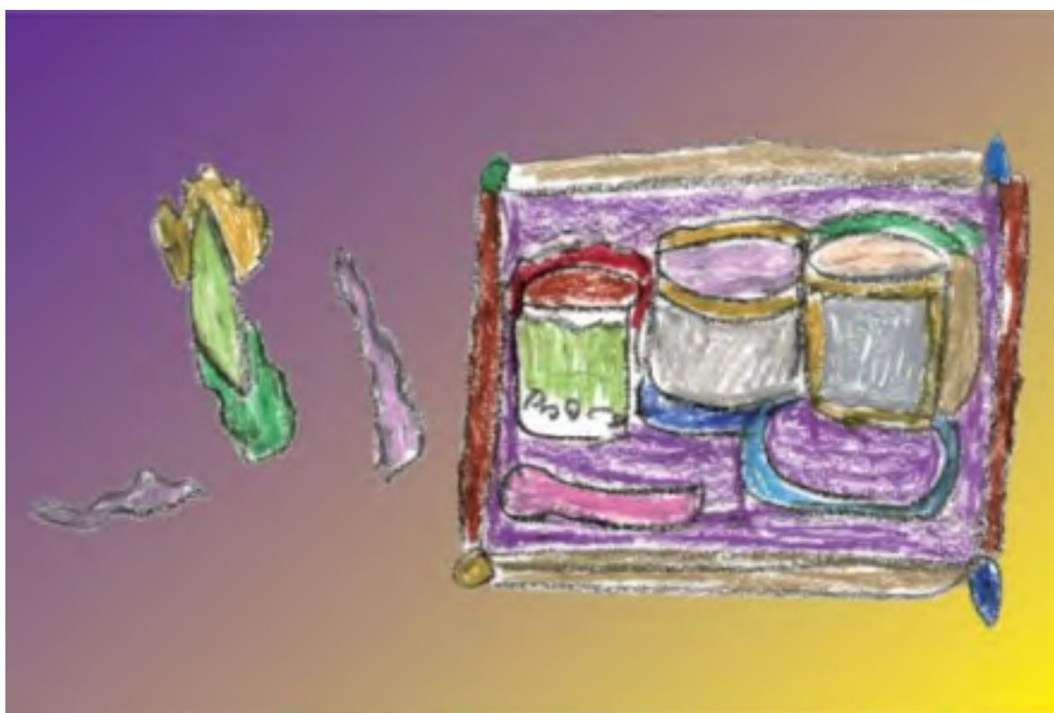
つわぶき会カレンダー 令和元年12月から

http://www.tuwabuki.jp/O1_02_tayori_sosei.html