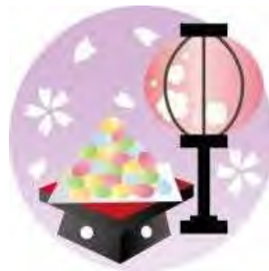
(綜成苑通所利用者 作)