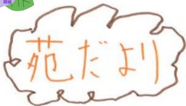
(綜成苑通所利用者)