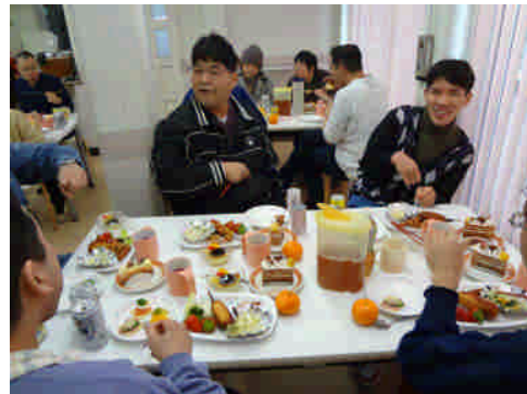
ごちそう 美味しそう