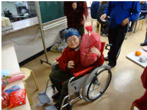
ビンゴゲームの景品 中身は何かなあ～