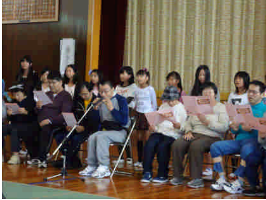
ファミリーコンサート