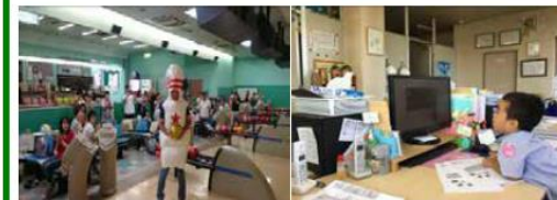
委員会主催の 「職員ボウリング大会」